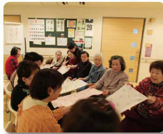
タオルでボール渡し