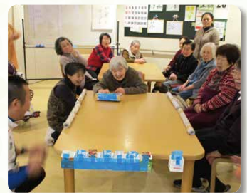
ピンポンでカップ