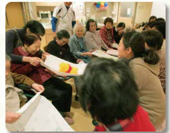
タオルでプーさん渡し!