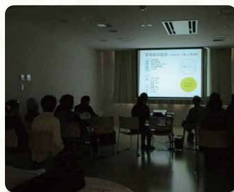
認知症サポーター講座