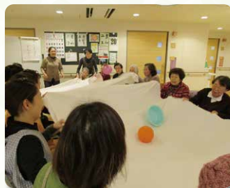
シーツでどんぶらこ