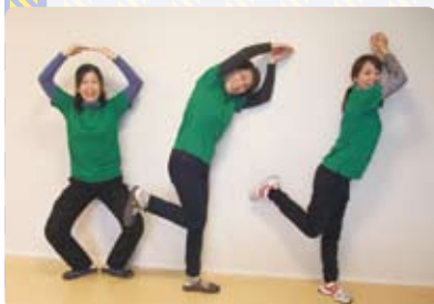
サービス提供責任者

した話や、ヘルパーの作るご飯の話等々、ブログで紹介しています。ぜひご覧になってください。