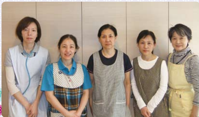
グループホーム職員一同

また事業計画のもう一つの柱である、“認知症ケアの向上”に関しては、職員の認知症実践者研修受講を通して、最新の認知症ケアを学び、ご利用者の日々の援助に反映させていく予定としています。今年度でもご利用者の健康管理と事故防止に努めながら、毎日をいきいきと生活していただけるよう職員一同、頑張っていきます。白島荘の中の小さな「華の家」をこれからも応援よろしくお願い致します。