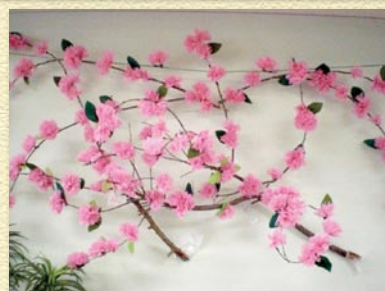
4月♪箕面には桜がいっぱい♪