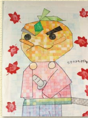
①「秋のゆずる君」 箕面市のキャラクター「たきのみち ゆずる」君をドットで根気よく描きました。