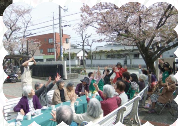
石丸地区福祉会の方々との合同お花見会