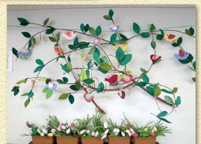
5月は新緑♪小鳥のさえずり♪