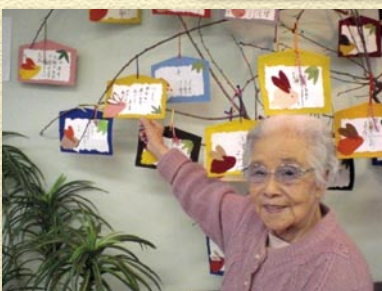
正月はみんなで絵馬を飾ったヨ♪