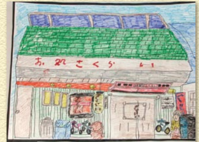
②「僕の働く店」 食堂で働く仲間の作品。お店の雰囲気伝わってきます。