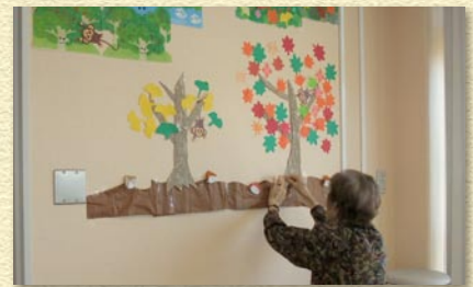
「どこに貼ろうかな」と一生懸命考えてくださっています。