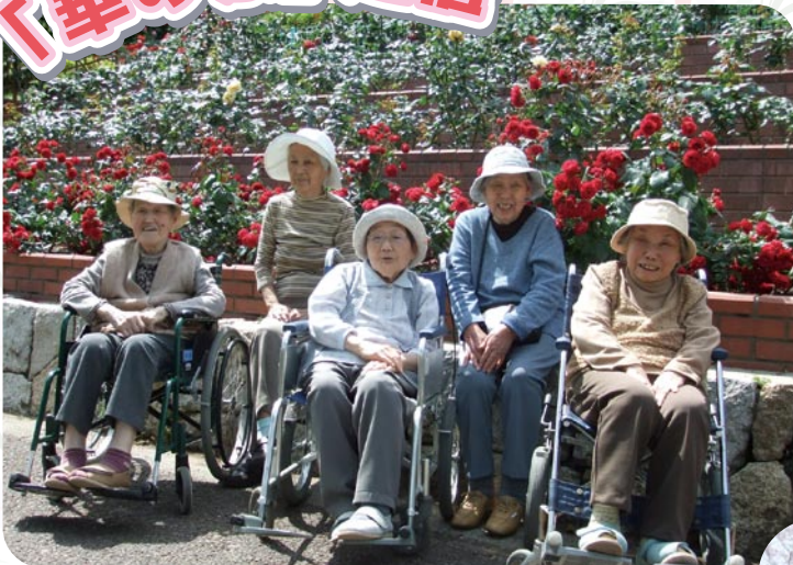
豊中市ノ切公園にて

寒い冬が過ぎ、春がきました。「華の家」の皆様は、デイサービスご利用の方々も加わられて仲良くにぎやかに日々の生活を送られています。