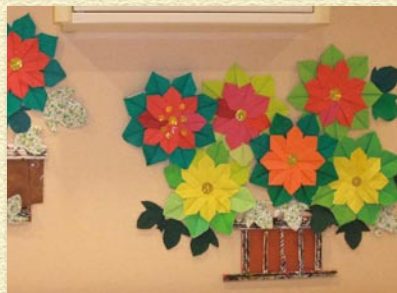
平成22年クリスマス