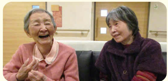
食後の団らんの一時