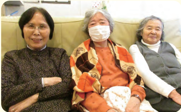
仲良く3人並んで写真撮影

「華の家」では随時ブログを更新しています。 楽しい状況をお届けしていますので、是非ともご覧になって下さい。